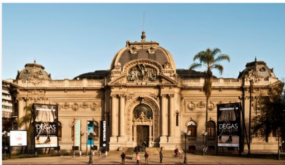
MUSEO NACIONAL BELLAS ARTES