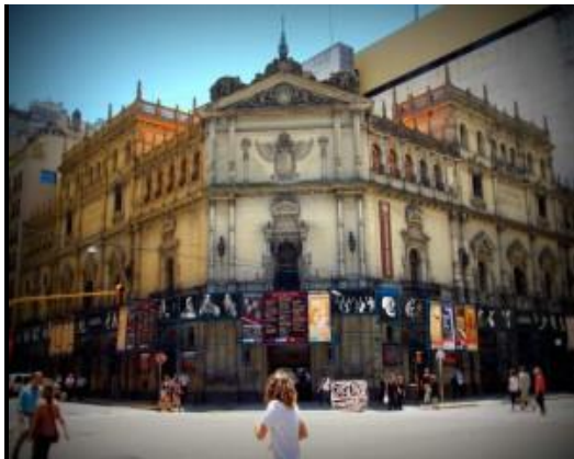
TEATRO NACIONAL CERVANTES