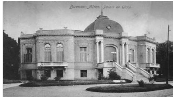
EX - PALAIS DE GLACE