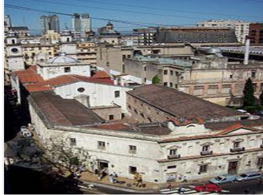
MANZANA DE LAS LUCES