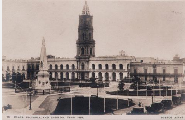
CABILDO HISTORICO BUENOS AIRES